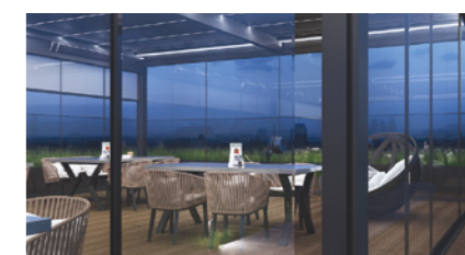
Système coulissant intégré, qui crée un rideau transparent qui ne bloque pas la lumière naturelle et offre des conditions contrôlées.