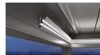
Des bandes de LED avec un éclairage réglable et la possibilité de les monter à la fois sur les stores et autour des traverses, offrant un éclairage élégant, visible ou caché.