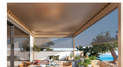
Ombrage vertical supplémentaire grâce aux stores spéciaux de technologie ZIP.